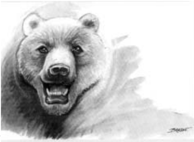
Aquarelle de Bressot

Suite au colloque d'Orléans et en rapport étroit avec l'actualité, de jeunes chercheurs et des acteurs de terrain exposent ici leurs travaux, réflexions et expériences de terrain.